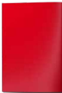
Anzeige 1/1 Seite U2/U3/U4, 210 x 297 mm 3.500,00 EUR