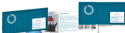
Beileger: lose beigelegt, beispielsweise DIN-Lang, 6-Seiter (Spezifikationen auf Anfrage)