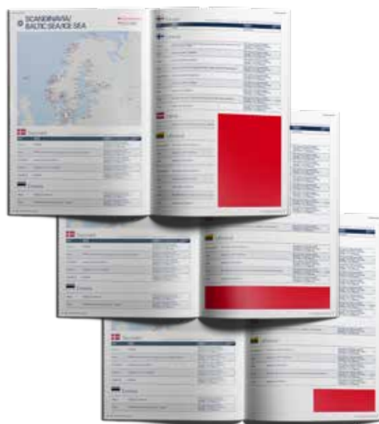
1/4 Seite, 90 x 130 mm, 800,00 EUR 1/1 Banner, 185 x 31 mm 500,00 EUR 1/2 Banner, 90 x 31 mm 250,00 EUR