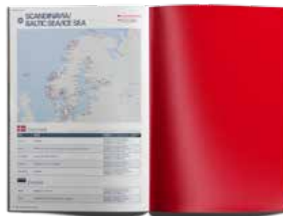
Anzeige 1/1 Seite, 210 x 297 mm 2.500,00 EUR

Bankverbindung: Hamburger Sparkasse IBAN:DE88 2005 0550 1048 2156 59 BIC:HASPADEHHXXX