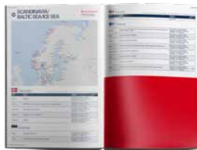
Anzeige 1/2 Seite, 210 x 145 mm 1.500,00 EUR